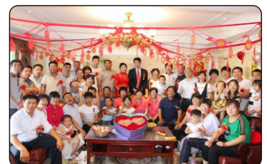
小家庭融入大家庭